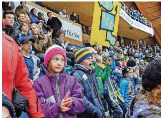
Zum sechsten Mal erhielten die jungen Patienten die Möglichkeit, einen HCD-Match zu besuchen.

Die Aktion kam dank der Zusammenarbeit mit der Stiftung Solveta zustande, wie es weiter heisst. Im Rahmen dieser Zusammenarbeit erfolgten be-