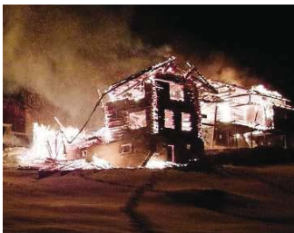
In Stels standen in der Nacht auf gestern ein Haus und eine Remise in Vollbrand. (ZVC)

STELS Ein Haus und eine Remise sind in der Nacht auf gestern in Stels oberhalb von Schiers ein Raub der Flammen geworden. Wie die Kantonspolizei mitteilte, wurde der Brandausbruch kurz nach 1.30 Uhr der Polizei-Einsatzzentrale gemeldet. Die Feuerwehr Vorderbrättigau war mit rund 40 Personen im Einsatz. Da das Haus leer stand, kamen weder Menschen noch Tiere zu Schaden. Aus einem Stall in der Nähe wurden vorsorglich 55 Tiere evakuiert. Die Brandursache wird derzeit abgeklärt. Der Sachschaden dürfte mehrere Hunderttausend Franken betragen. Laut Polizeiangaben wurde die Liegenschaft gerade umgebaut. (BT)